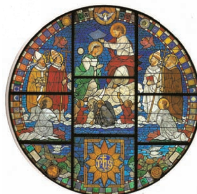
Il rosone restaurato del Duomo di Volterra

Contributo a favore delle popolazioni colpite dal terremoto in Marche e Umbria