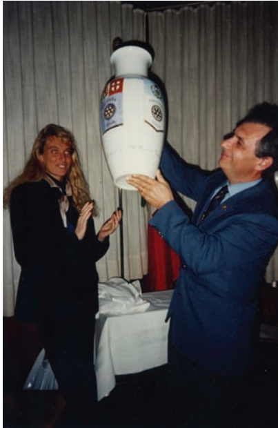
Consegna di un premio