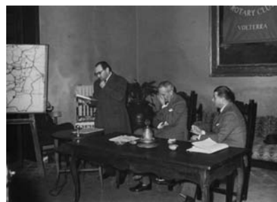
Conferenza del Rotary Club Volterra sulla viabilità

Organizzazione della mostra personale del pittore Krimer a Volterra