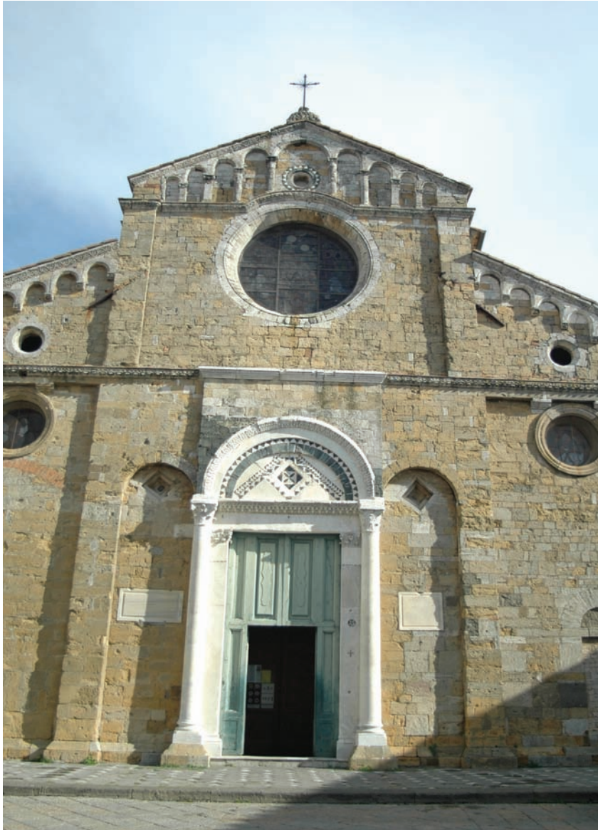
Il Portale del Duomo di Volterra completamente restaurato