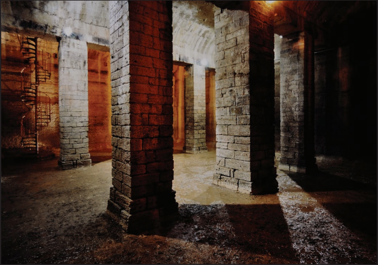
Interno della cisterna Romana, per il volterrani "La Piscina"