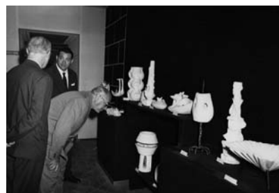
Prodotti in alabastro per la promozione della Campagna "Polio-Plus"